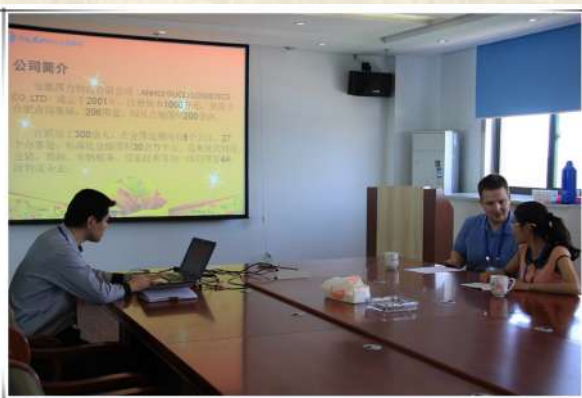
合肥学院师生来我公司参观学习