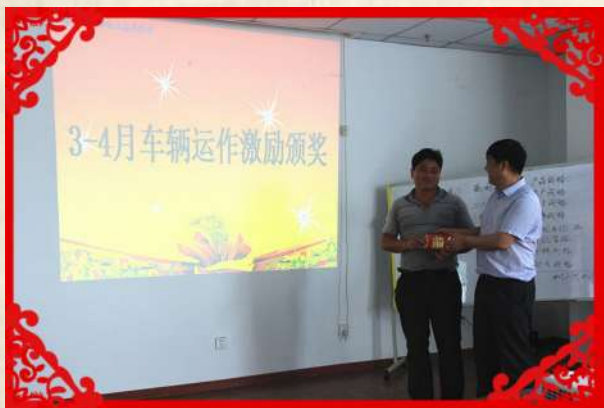
3、4月份车辆运作激励颁奖